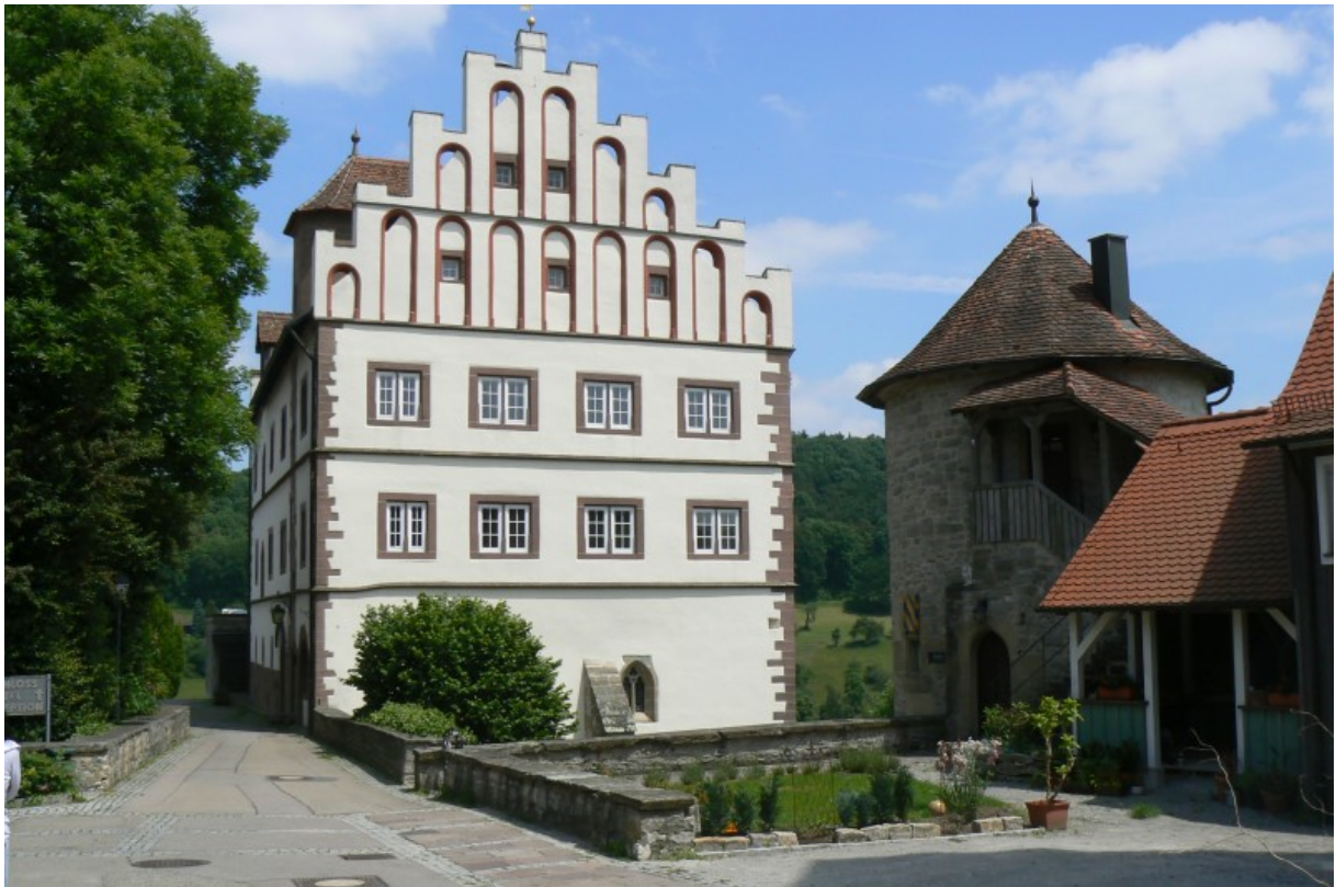
Schlossgebäude und Kanzleiturm (rechts)

Durch den Graben entstand ein ca. 40 Meter breites und 70 Meter langes Areal, welches zur Spornspitze hin schmaler wird. Das heutige Schloss befindet sich an der Südwestecke direkt neben dem Halsgraben. Das dreigeschossige Steingebäude mit einem trapezförmigen Grundriss wird von auffälligen Staffelgiebeln verziert.