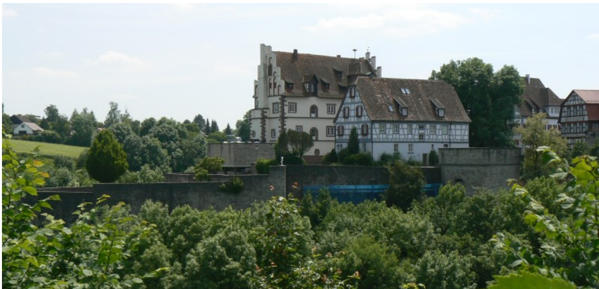
Schloss Vellberg von der Stöckenburg gesehen

Malerisch schön thront das Hohenloher Städtchen Vellberg über einer Schleife des Flusses Bühler. Schloss und Altstadt bilden dabei ähnlich wie im nördlich gelegenen Kirchberg an der Jagst 1 oder der hohenloheschen Waldenburg 2 eine harmonische und verteidigungstechnische Einheit. Mit Gräben, Zwingern, Bastionen und Ecktürmen und einem rundum laufenden unterirdischen Wehrgang geschützt, macht dieser Ort heute noch einen wehrhaften und mittelalterlichen Eindruck im Grün der ihn umgebenden Natur. Den Wanderer locken die malerischen, renovierten Gassen und Gebäude und die weitläufige Landschaft der Limpurger und Ellwanger Berge.