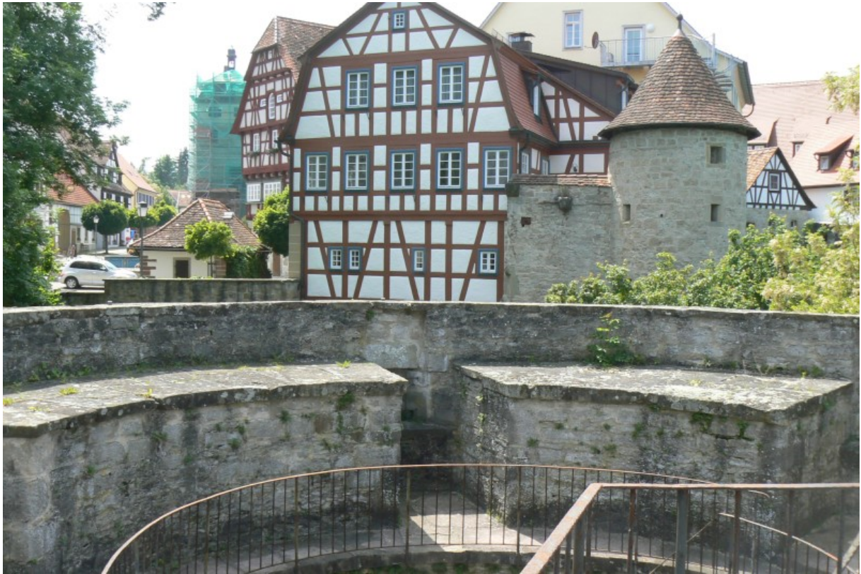
Blick vom Geschützturm über den Halsgraben auf die Stadt