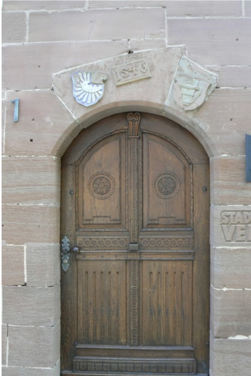
Eingang mit Allianzwappen

Neumodisch überbaut führt hier eine Treppe auf ein tiefer gelegenes Niveau, dem sogenannten einstigen „Burghof“. Hier dominiert der halbrunde Rest der Bastion, welche einst mit heute verschütteten Kasematten unterhöhlt war. Dieser Bastion scheint ein weiterer halbrunder Zwinger vorgelagert gewesen zu sein. Die Reste sind von Gestrüpp überwuchert und unter der Bastion gut sichtbar erhalten. Von der Bastion führt ein rampenartiger Weg nach Westen hinunter in den Zwinger. Durch einen Vorbau führt hier ein dreitüriges Tor direkt in den Zwinger unter den runden Geschützturm, welcher die Nordwestecke der Burg und gleichzeitig das Tor zur Stadtmauer beschützte. Dieser mehrstöckige Geschützturm kann von oben und von unten über Treppen betreten werden.