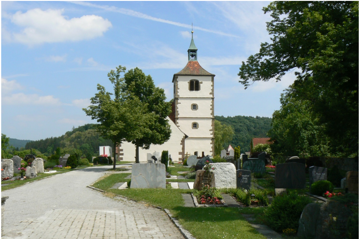
Martinskirche von Westen gesehen

Auf einem Bergkegel nördlich von Vellberg befindet sich heute an höchster Stelle die spätgotische Martinskirche mit dem westlich davon gelegenen Friedhof. Natürlich geschützt vom tiefen Tal der Bühler im Süden und vom Aulenbach im Osten und Norden, bot der Bergstock mit ca. 5,2 ha Fläche Platz für eine eventuell schon in vormittelalterlicher Zeit genutzte Großbefestigung bzw. Kultstätte. Steile Hänge bilden ein im Grundriss verschobenes Rechteck. Funde aus der Bronzezeit lassen eine vorgeschichtliche Besiedlung vermuten. Hier soll einst ein fränkischer Königshof gestanden haben. 822 wird die Kirche „basilica sancti martini“ im „Castrum Stochamburg“ als Würzburger Besitz erwähnt. Diese Kirche soll bereits 741