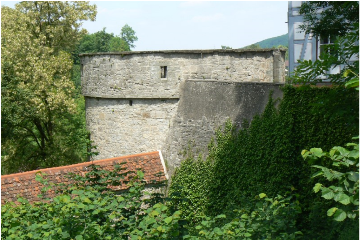
Geschützturm von der Stadt gesehen

Ab diesem Zeitpunkt berichten Urkunden immer wieder von einem „Unteren Haus“ und einem „Oberen Haus“. Bis 1480 kauften die Vellenberger die fremden Besitzanteile wieder zurück und vereinigten den Burgbesitz erneut. Bereits 1466 begannen die Vellenberger die Burg weiter zu befestigen. Die Befestigung der Burg und des Ortes war zu Beginn des 16. Jahrhunderts abgeschlossen. 1481 wurde zwischen den 6 Vellenberger Besitzern ein Burgfried vereinbart und die nächsten sechs Jahre ein Investitionsrahmen zum Ausbau der Befestigungsanlagen festgelegt. Diese Befestigungswerke hielten vielen Angriffen stand, wurden aber kampflos im Jahre 1523 bei der „Absberger Fehde“ vom Schwäbischen Bund eingenommen. Das Schlossgebäude Wilhelms von Vellberg wurde zerstört, da dieser dem Absberger Raubritter Wilhelm von Absberg Unterschlupf gewährt hatte. Zwischen 1543 und 1546 9 wurde das Schlossgebäude neu errichtet. Renaissanceformen sucht man vergeblich, die Staffelgiebel wirken mit ihren Pfeilern und Rundbögen spätgotisch. 1592 starben die Vellberger mit Konrad von Vellberg aus. Das Erbe fiel zu Teilen an Hohenlohe und die Stadt Hall. Die Stadt Hall erwarb 1598/1600 den Hohenloher Teil und Vellberg wurde bis 1802 als reichsstädtisches Landamt verwaltet.