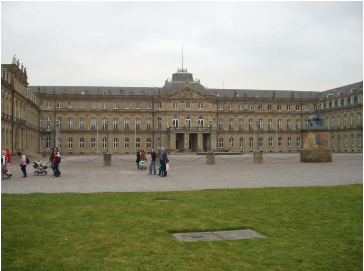
Ehrenhof Neues Schloss