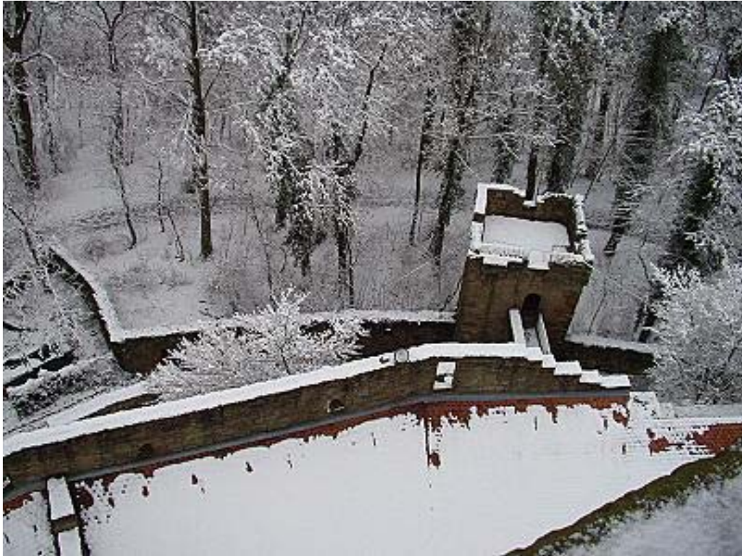
Blick vom Bergfried auf die Zwingeranlagen- Hier der zweite Torturm