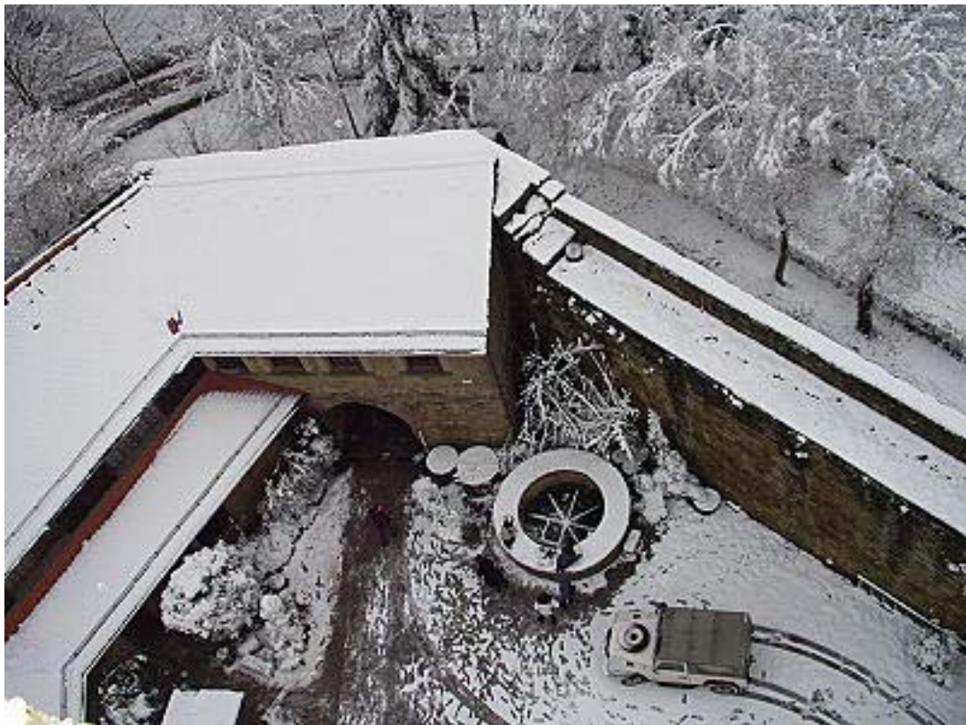
Torhaus mit dem rundbogigen Eingang zur Kernburg. Rechts davor die Zisterne, links Nebengebäude mit Pulldächern.