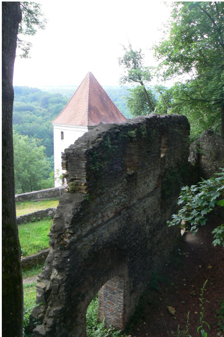
Südbau mit Blick auf den Südostturm über dem Lonetal

1435 wurde die Burg von 100 Armbrustschützen und mehreren Kanonen (laut Gradmann 9 Geschütze, laut Hummel 10 2 Kanonen) eines Heeres aus Nürnberg 11 belagert. Grund war, dass die Riedheimer einem Nürnberger Bürger (Werner Roßhaupter) Unterschlupf gewährten. Dieser hatte Geld an Nürnberger Bürger verliehen und hatte Geiseln genommen, nachdem er das Geld nicht zurückerhielt. 50 Mann verteidigten die Kaltenburg, und trotz starker Schäden an der Feste konnte der Feind zurückgeschlagen werden. Der Kaiser ächtete die Riedheimer, bis diese sich von dem Nürnberger Bürger lossagten, der aber entkommen konnte. Erweitert wurde die Gesamtanlage von 1450 bis 1560 unter den Herren von Grafeneck. Erst 1632 wurde die Burg durch die Schweden im Dreißigjährigen Krieg zerstört. Beim Wiederaufbau 1677 wurden die beiden Ecktürme auf der Ostseite errichtet. Danach verfiel die Kaltenburg zusehends und wurde erst im 20. Jahrhundert renoviert.