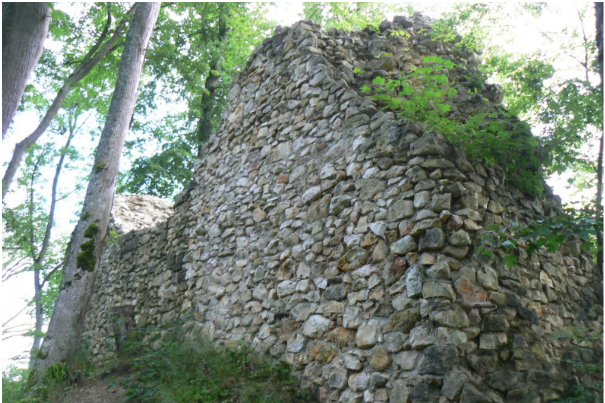
Westseite des Wohnturmrestes (vor der Sanierung)

An der Nordostecke befindet sich ein Anbau am Turm, dieser wird heute als Schutzhütte verwendet. Im Burghof ist die innere Zwingermauer nicht mehr vorhanden.