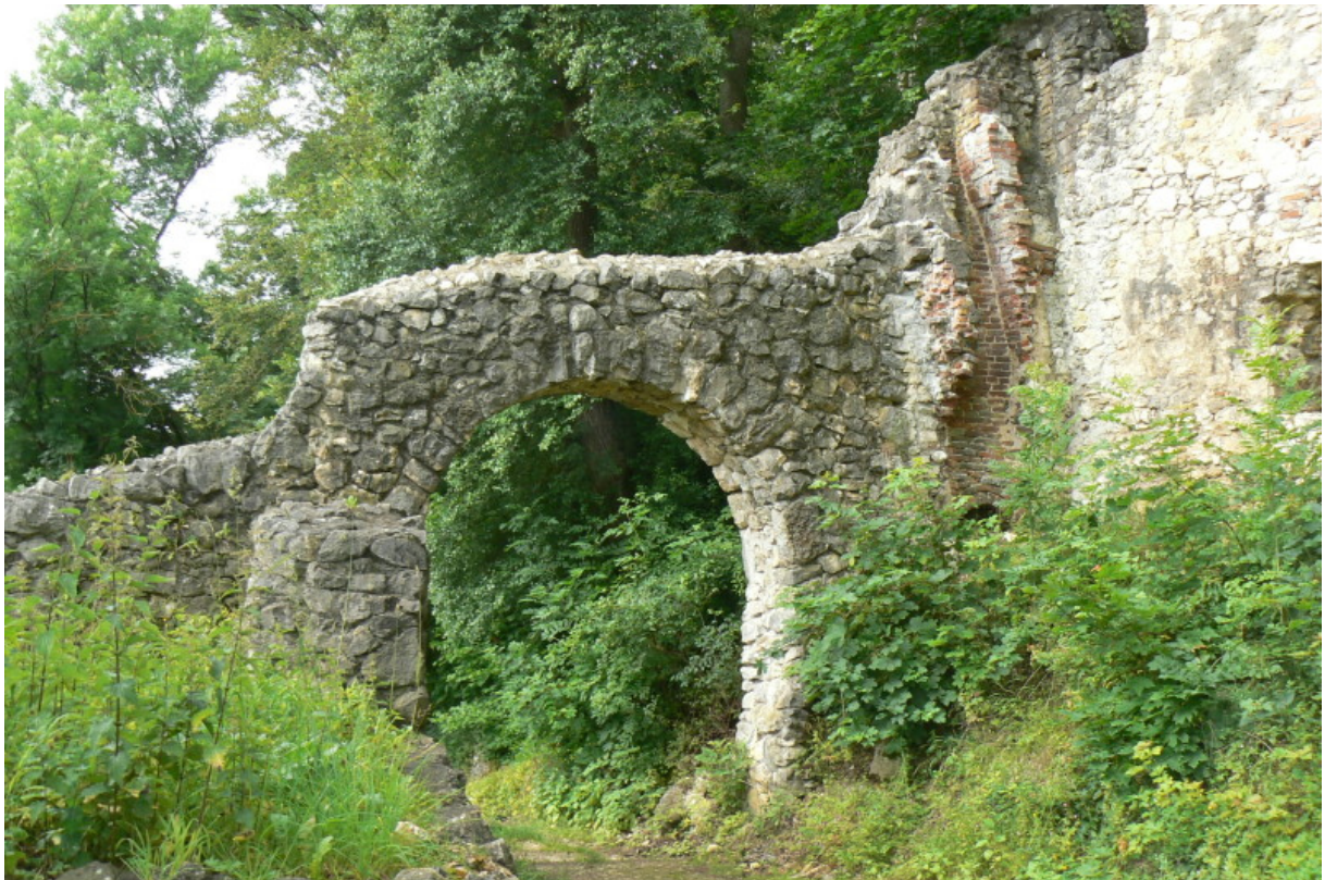
Inneres Tor mit Kaminrest (vor der Sanierung)

Rechts, an der Südostecke, steht ein restaurierter Eckturm mit Spitzdach. Nach dem einstigen Zwinger folgt das zweite Tor. Hier befand sich früher ein Torhaus, durch welches das Tor in den Innenhof führte. Ein Rest von Wohnlichkeit finden wir direkt hinter dem Tor an der Mauer- den Rest eines alten Kamins, welcher dem Torwächter einst Wärme spendete.