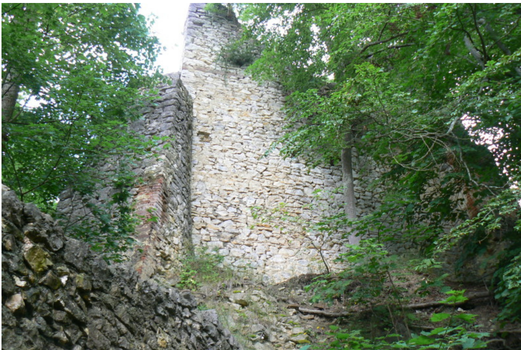
Schildmauer des südlichen Bauwerkes von innen gesehen (vor der Sanierung)

Auf der Südwestseite des Burgareals befindet sich der Rest eines weiteren Gebäudekomplexes, von welchem noch die Ostmauer mit einem Zugang vorhanden ist. Der einst große Bau grenzt an den Halsgraben des nördlichen ersten Baus. Zum Westen- zur Angriffsseite- ist die über 2 Meter dicke Mauer des Komplexes schildmauerartig verstärkt 2 und ragt heute noch in die Höhe. Antonow datiert diesen Bau auf das 14. Jahrhundert.