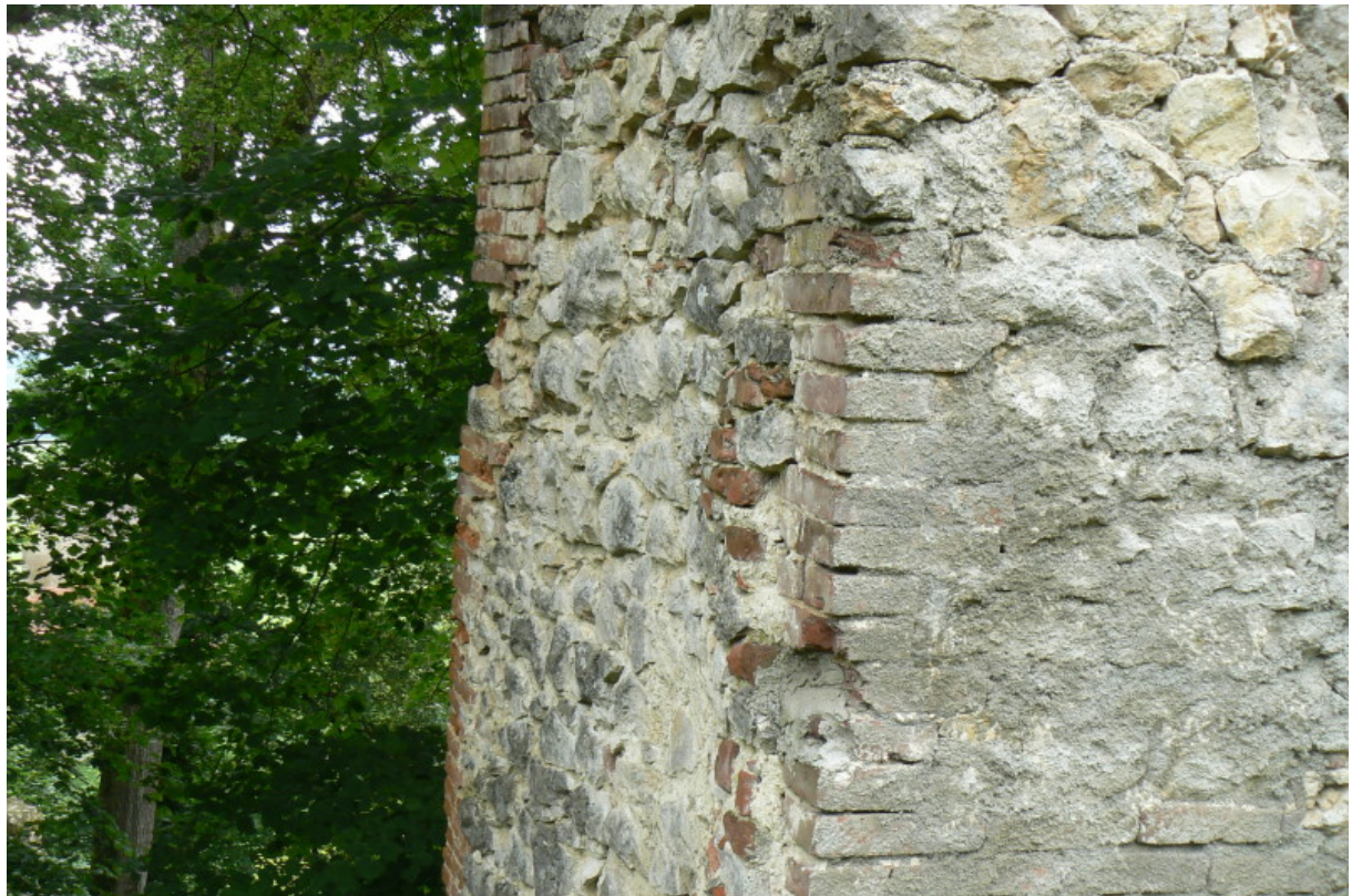
Ziegelmauerwerk an der Schildmauer des Südbaues

Baulich auffällig ist die häufige Verwendung von Ziegelsteinen als Baumaterial der Gebäude, was in Süddeutschland bei Burgenbauten sehr selten zu finden ist. 4