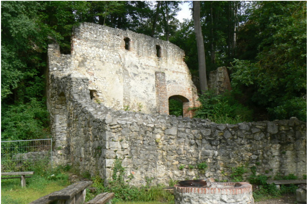
Südwestbau und Tor

Am Zusammenfluss der Hürbe und der Lone befindet sich ein nach Nordwesten verlaufender Bergsporn. Aus den Baumkronen des heute dicht bewaldeten Spornes ragt einer der Ecktürme der Burg empor. Ein Wanderer an der Lone kann leider an dem Sporn vorbeilaufen, ohne die Burg zu bemerken. Doch der Aufstieg auf den Berg lohnt sich. Den Besucher erwartet nicht nur ein schöner Blick über das Tal, sondern auch mächtige Mauerzähne der alten Ruine.