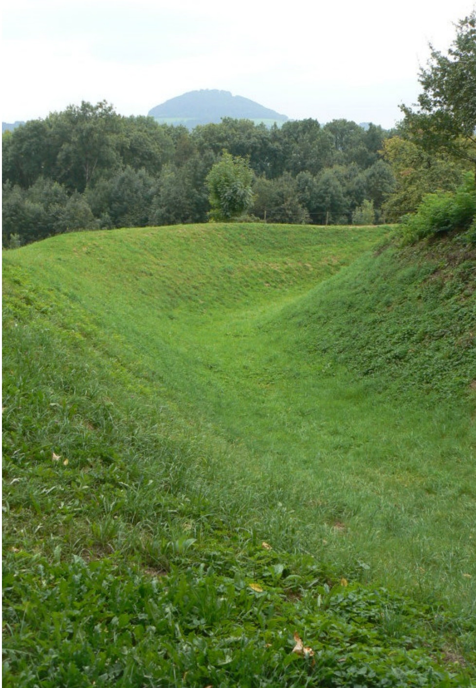
Ringgraben mit Blick auf den Hohenstaufen

Bis 1857 erfolgte ein reger Besitzerwechsel. Danach fällt der Besitz an Württemberg 11 . Erst 1916 stürzte ein Teil der Umfassungsmauer ein und die Burg wurde im 20. Jahrhundert umfassend saniert.