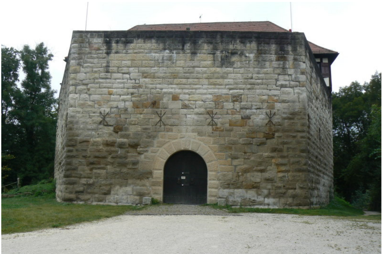
Tor vom Vorburggelände gesehen

Die Wäscherburg zeigt noch den typischen Aufbau einer kleinen Wehranlage des niederen Adels, bzw. einer Vasallen- oder Vogtsburg, welche einer größeren Burg politisch und strategisch zugeordnet war. Die klassische mittelalterliche Burg war nicht die im romantischen Sinn verklärte große Wehranlage mit Zwingern, Toren, Gebäuden und vielen Türmen. Wesentlich häufiger waren diese Kleinburgen. Oft im Laufe der Jahrhunderte verschwunden und nur noch als Burgstall vorhanden oder aber in späteren Epochen erweitert und ausgebaut, findet man heute nur noch wenige solcher Burgen. Wohntürme mit nur einem turmartigen Gebäude oder die Kombination Turm und Palas waren in fast jedem Ort Süddeutschlands im Mittelalter „Standard“- oder eben dieser Typ, den wir in der Wäscherburg finden: Palas und Hof. Der Aufbau der Burganlage ist relativ einfach. Auf einem nach Osten verlaufenden Bergsporn, welcher leicht an den Seiten zum Tal hin abfällt befindet sich der Burgweiler Wäscherhof.